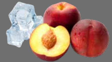
Pfirsich Eistee Sirup