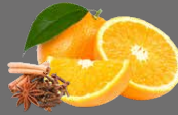
Orange-Ingwer Punsch Sirup