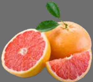
Pink Grapefruit Sirup