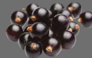
Schwarzer Johannisbeer Sirup (125 % Fruchtanteil)