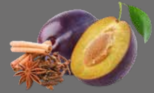
Zwetschgen Punsch Sirup