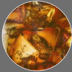
Kola-Orange Limonade Sirup