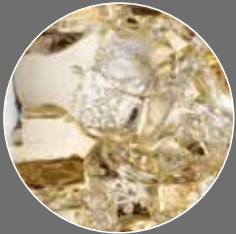
Zitronen Limonade Sirup