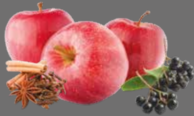
Apfel-Holunderbeere Punsch Sirup