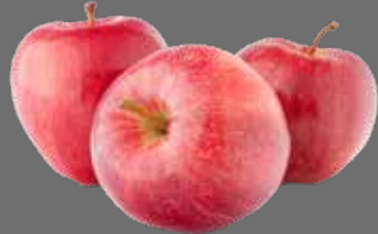
Apfelsaft Konzentrat klar od. naturtrüb