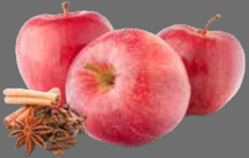
Apfel naturtrüb Punsch Sirup

ALKOHOLFREIER PUNSCH. FÜR DIE KALTE JAHRESZEIT.