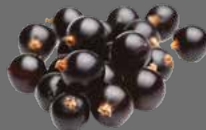
Schwarzer Johannisbeer Sirup