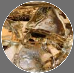
Kräuter Limonade Sirup