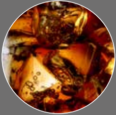
Kola Limonade Sirup