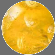
Orangen Limonade Sirup